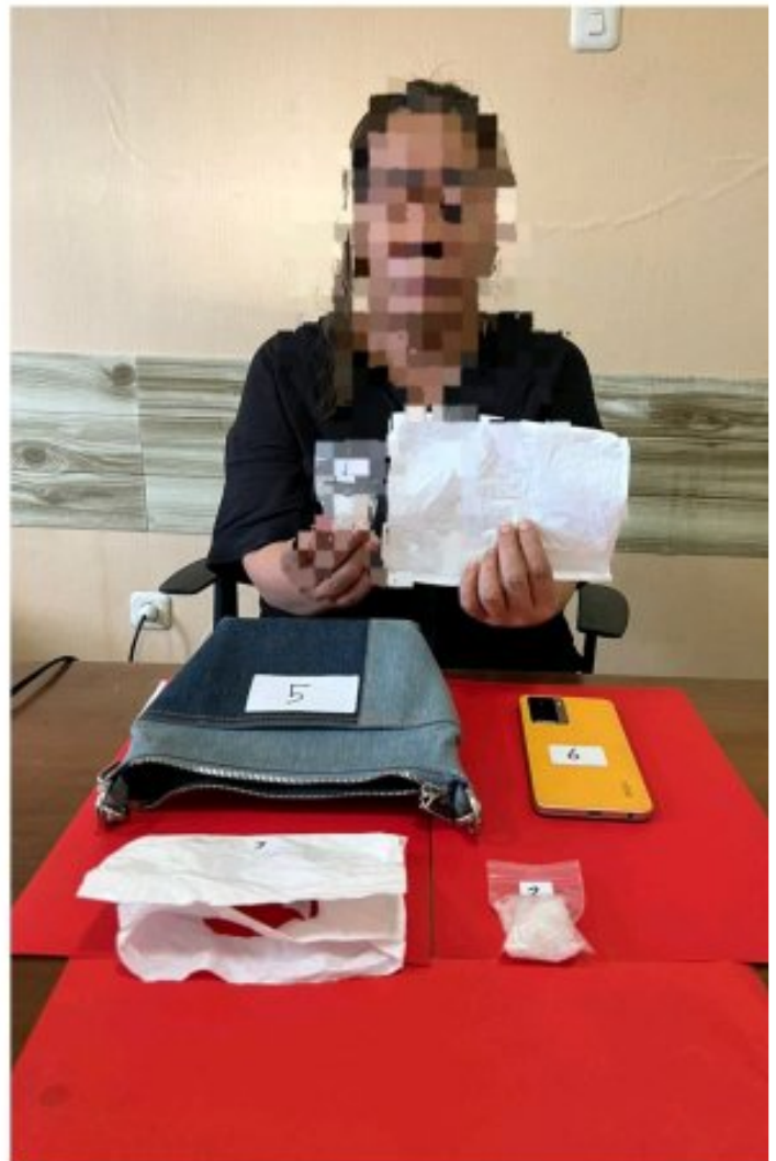
Tampak 2 wanita di tangkap Satreskoba Polres Morowali

MOROWALI, Sulawesi Tengah- Satuan Reserse Narkoba Polres Morowali Polda Sulteng, berhasil mengungkap kasus penyalahgunaan narkotika jenis sabu di Desa Topogaro, Kecamatan Bungku Barat, Kabupaten Morowali Propinsi